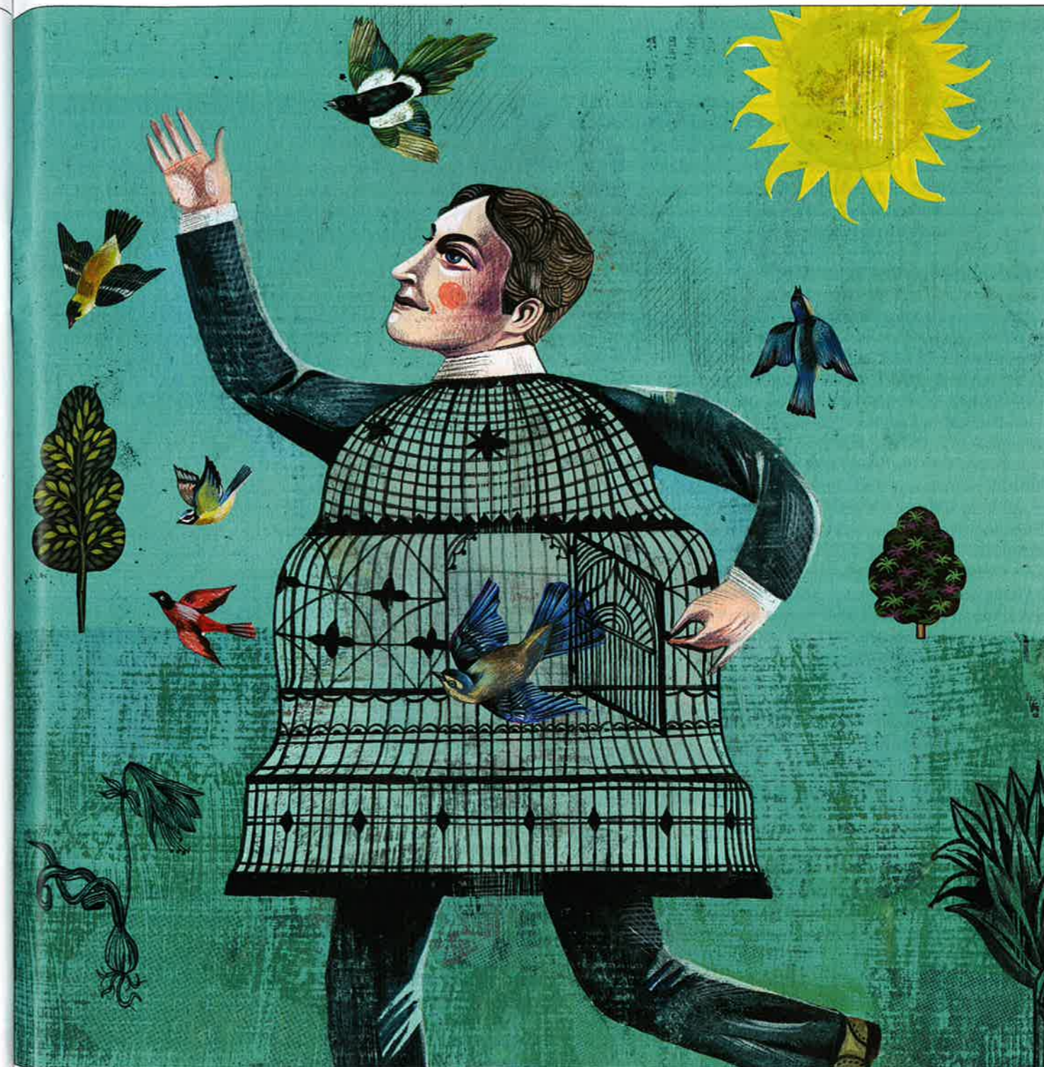
ILLUSTRATION: OLAF HAJEK

meistens bei anderen. So natürlich diese Reaktion auch ist: Es ist in jedem Fall hilfreich, den Grund für die Spannungen nicht nur bei den anderen, sondern auch bei sich selbst zu suchen. Ich kann mich fragen, welches mein Anteil an einem Konflikt ist, den ich mit meinen Mitarbeitern oder auch mit meinen Kindern habe, oder warum ich so gekränkt auf meinen Vorgesetzten reagiere, obwohl andere in der Firma mit ihm viel besser klarkommen. Ich kann versuchen, mich in andere Menschen hineinzusetzen und dadurch verständnisvoller zu reagieren. So richtig und wichtig solche Überlegungen sind, manche Konflikte lassen sich dadurch nicht aus der Welt schaffen. Es bleibt gegenüber manchen Menschen auch dann, wenn wir den Konflikt ausgetragen haben, ein Rest, der sich nicht auflösen lässt. Und dann denken wir, es bleibe einem nur, die ande-